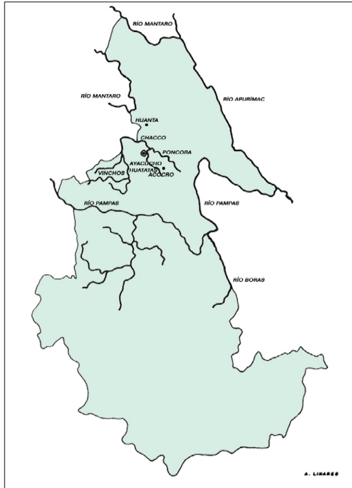
MAPA 1: Valles de Ayacucho